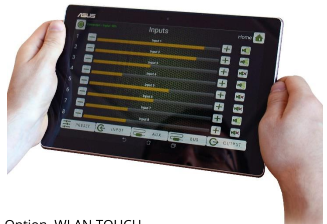
Option WLAN TOUCH

Bei unserem digitalen Prozessor SDM200 dreht sich alles um Audio Performance. Designed und engineered in Deutschland. Durch seinen modularen Aufbau können die Anzahl der Ein-/Ausgangskanäle, die Steuerbarkeit und die Anbindung an digitale Audionetzwerke wie DANTE und AVB je nach Anforderung optimal konzipiert werden. Die integrierte Mehrfach-Lautsprecherendstufe vervollständigt die ALL IN ONE Konzeption.